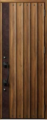
チーク 設定色：7・8・10・18・19 22・27