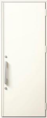
ナチュラルホワイト 設定色：1・2・3・4・5・6・9・11 12・13・14・15・16・17・20・21 23・24・25・26・27・28・29