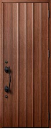
ポートマホガニー 設定色：7・8・10・18・19 22・27