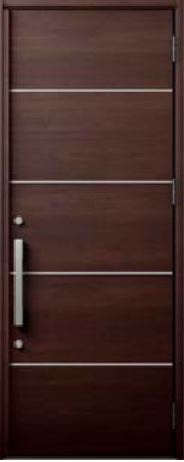
クリエダーク 設定色：2・3・4・5・6・11・12 13・14・15・16・17・24