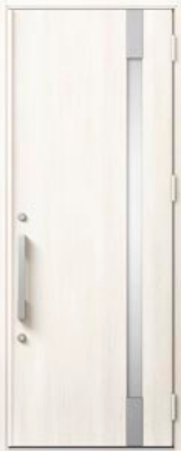
クリエアイボリー 設定色：1・2・3・4・5・6・11 12・13・14・15・20・23・24