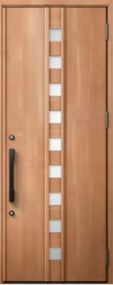
ミディアムチェリー 設定色：1・2・3・4・5・6・15 20・21・23・24・25・26