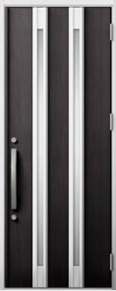
トリノパイン 設定色：1・2・3・4・5・6・9 15・16・17・20・23・24