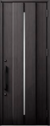
トリノパイン 設定色：1・2・3・4・5・6・15 20・21・23・24・25・26