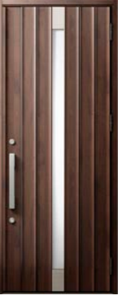
アンティークオーク 設定色：3・4・5・6・7・8 18・22・23・24・27