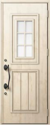
エクリュアイボリー 設定色：7・8・10・18 19・22