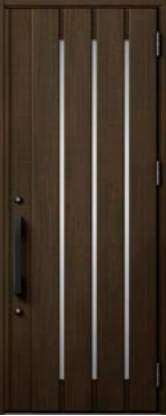
ゼンオーク 設定色：2・3・4・5 23・24・28・29