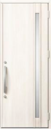
クリエアイボリー 設定色：1・2・3・4・5・6・15・16 17・20・21・23・24・25・26