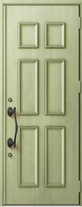
リーフグリーン 設定色：7・8・10・18・19・22