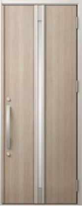
グレイッシュオーク 設定色：1・2・3・4・5・6・9・15 16・17・20・21・23・24・25・26