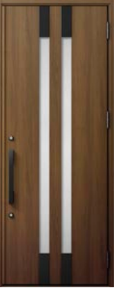
クリエモカ 設定色：1・2・3・4・5・6・11 12・13・14・15・20・23・24